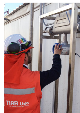
Instalación del caudalímetro